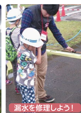
漏水を修理しよう!