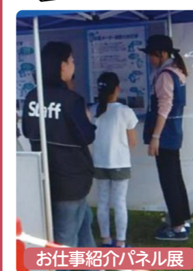
お仕事紹介パネル展