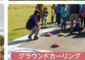
グラウンドカーリング