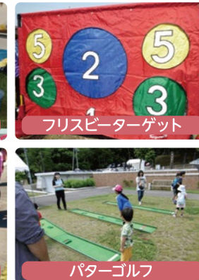
フリスビーターゲット